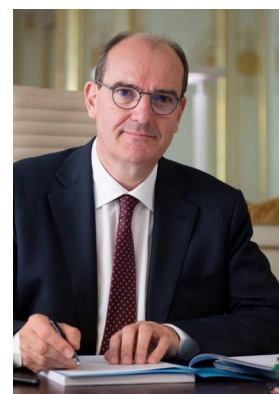
Jean CASTEX Premier Ministre

« C’est avec une méthode nouvelle que nous prenons, ensemble et à bras le corps, cette crise. Avec une obsession en tête et une priorité absolue : la lutte contre le chômage et la préservation de l’emploi en France. C’est aussi à cette France des territoires, à cette France de la proximité que nous devons impérativement faire confiance, car c’est elle qui détient en large part les leviers du sursaut collectif. Les territoires, c’est la vie des gens. Libérer les territoires, c’est libérer les énergies. C’est faire le pari de l’intelligence collective. Nous devons réarmer nos territoires, nous devons investir dans nos territoires, nous devons nous appuyer sur nos territoires. C’est l’objet de la relance. »