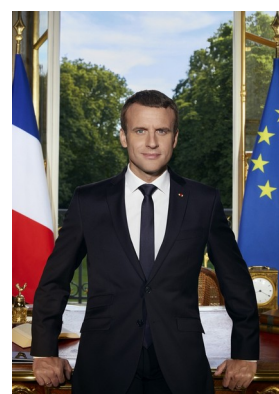
Emmanuel MACRON Président de la République

« La France de 2030 devra être plus verte, plus respectueuse du climat. C’est pourquoi France Relance vise à accélérer la conversion écologique de notre économie et de notre tissu productif. [...] La France de 2030 devra être plus indépendante, plus compétitive, plus attractive. Il s’agit de ne plus dépendre des autres pour les biens essentiels, de ne plus risquer des ruptures d’approvisionnements critiques. Il s’agit de produire et de créer des emplois en France : avec France Relance, notre Nation reprend son destin économique en main. [...] La France de 2030 enfin devra pouvoir compter sur des femmes et des hommes bien formés. France Relance investit donc massivement dans ce qui fait la richesse de notre Nation : l’humain. Plans de maintien de compétence pour ne pas perdre les savoir-faire dans les entreprises qui traversent des difficultés passagères, nouvelles formations pour les jeunes dans les secteurs d’avenir, programmes d’insertion par l’activité économique ou associative : France Relance, c’est un projet pour les Françaises et les Français.